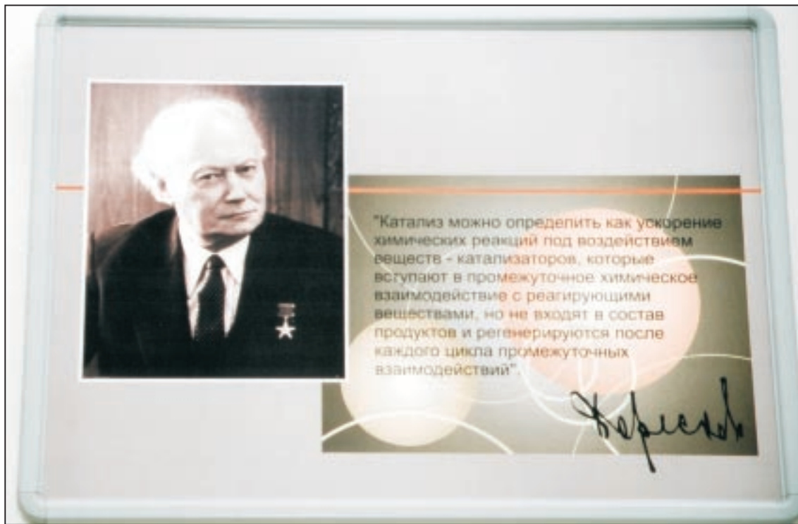
Георгий Константинович Борсков.